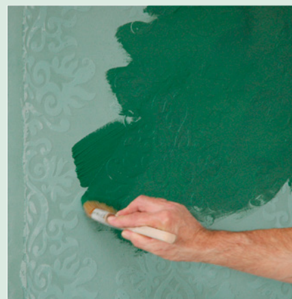
Auf Wunsch kann die Fläche noch mit farbloser / eingefärbter Jaeger Antik Seife bearbeitet werden.