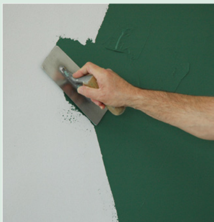
Richtungsloses, gratfreies Auftragen von Epoca Marmor 949, Farbton nach Wahl.