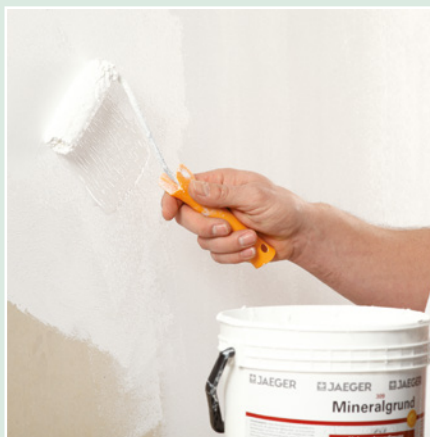
Grundieren der Fläche mit Jaeger Iso-Mineralgrund 309.