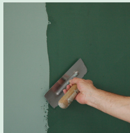
Sattes Auftragen der 2. Lage Epoca Marmor 949 im gleichen Farbton.