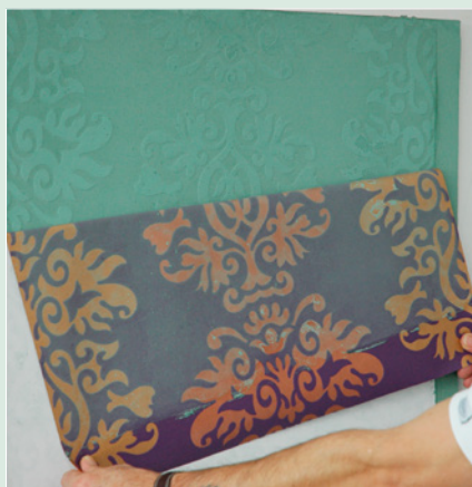
Nach mindestens 12h Trocknung: Tapete vorsichtig abziehen.