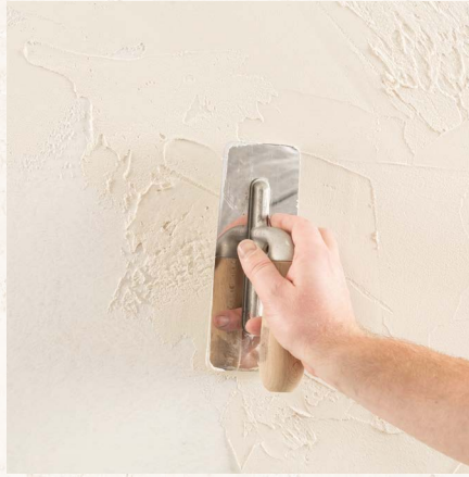
1. Lage Calce Argilla auftragen.