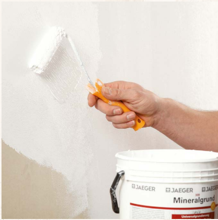
Grundieren der Fläche mit Jaeger Iso-Mineralgrund 309.