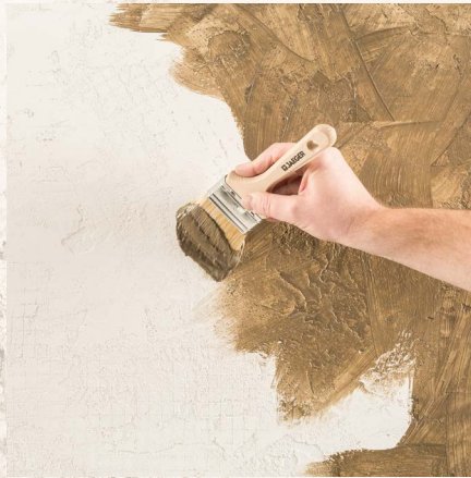
Auftragen der eingefärbten Antik Seife 985 oder Velatura 956.