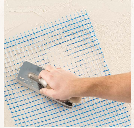
2. Lage Calce Argilla auftragen und die Fläche je nach gewünschten Effekten strukturieren.