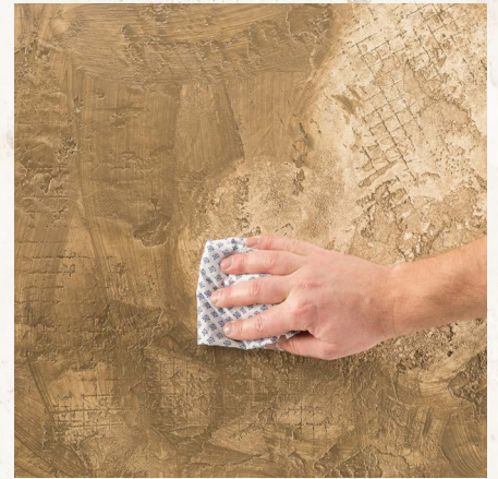
Überschüssige Seife mit einem Baumwollappen aufnehmen.