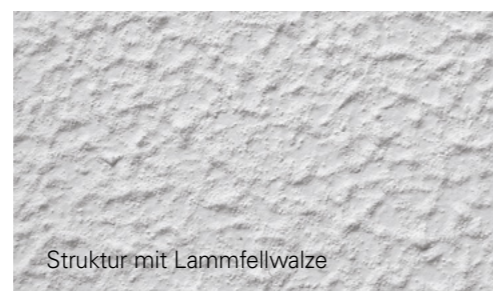
Struktur mit Lammfellwalze