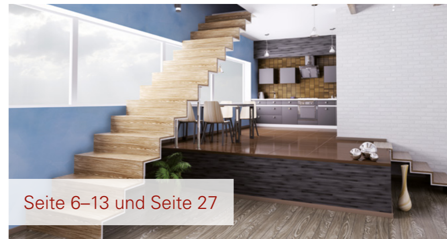
Seite 6–13 und Seite 27

Inspiration für jeden Raum – Unsere Kreativtechniken im Überblick