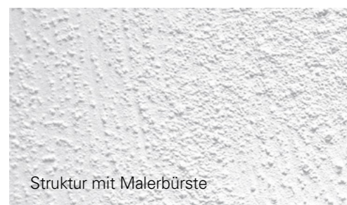
Struktur mit Malerbürste

Perfetto Dekorputz erfüllt höchste Ansprüche an Funktionalität, Kreativität und Optik. Als strukturgebende und deckende Beschichtung eignet er sich sowohl als Schlussanstrich als auch in der reizvollen Kombination mit der Velatura Fertiglasur . Durch die seidenglänzend wolkige Oberfläche wirken Räume heiter und luftig.