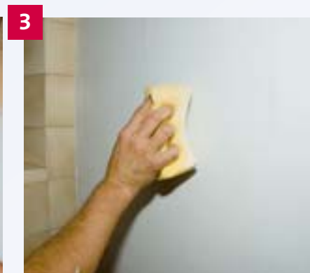
3 Die zweite Lage Fliesenspachtel wird, solange sie noch frisch ist, mit dem Schwamm ver-schiebt, um eine glatte Oberfläche zu erzielen.