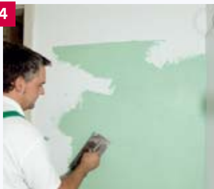
Nach der Trocknung des Fliesenspachtels kann die Fläche beispielsweise mit einem Kalkmarmorputz überarbeitet werden.