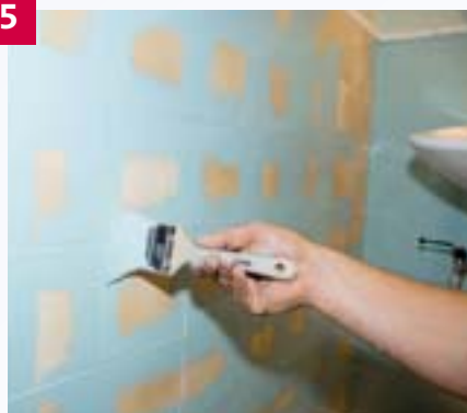
Wo Fliesen erhalten bleiben sollen, können sie mit einem Speziallack überarbeitet werden. Zuerst werden die Fugen vorgestrichen, ...