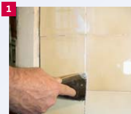
1 Sollen bestehende Fliesen überarbeitet werden, so müssen zunächst Risse und schadhafte Fugen ausgespachtelt werden.