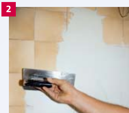
2 Direkt auf die alten Fliesen wird die spezielle hoch kunstharzvergütete Zementspachtelmasse in zwei Lagen aufgezogen.