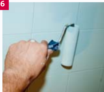
... sofort im Anschluss überrollt man die gesamte Fläche gleichmäßig mit einer Schaumstoffwalze.