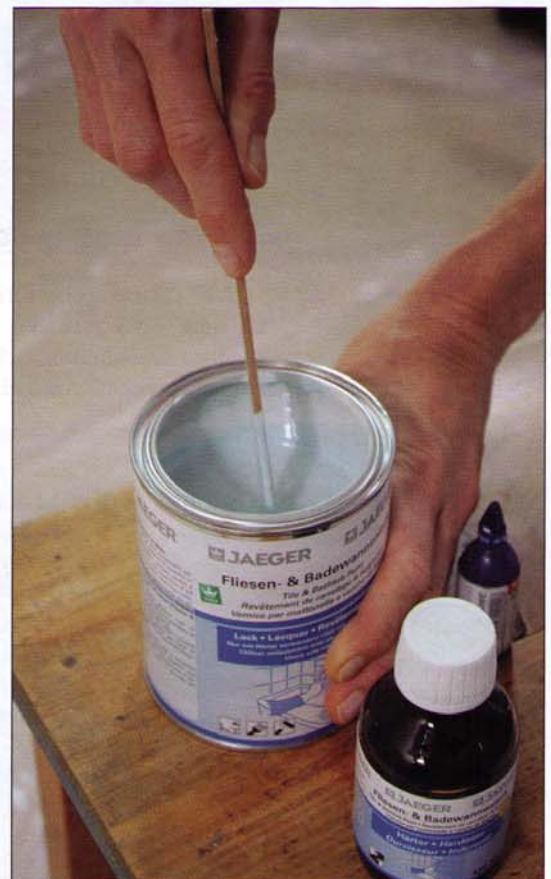
Das Fliesengebinde reicht für 6,8 qm

Das Badewannenset: Schnell und einfach wird die Badewanne wie neu