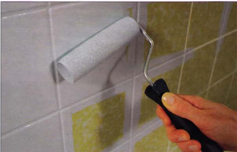
... dann die Fliesen. walze mit Bügel sowie eine Streichwanne. Lediglich zur Beschichtung von Acrylwannen muss noch die spezielle Acrylwannen-Grundierung gekauft werden. Auch die Verarbeitung ist denkbar einfach, da der 2-Komponenten-