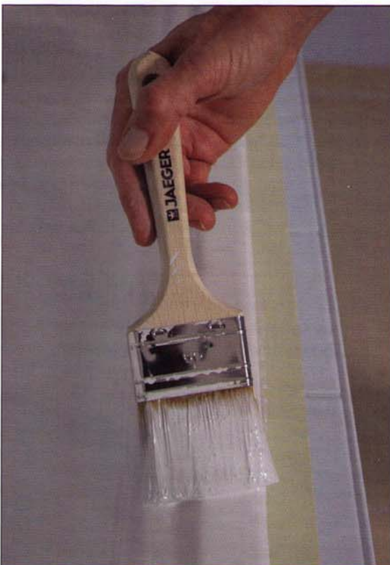
Von Profis für Profis: hier haart kein Pinsel

Die Firma Jaeger hat gut 30 Jahre nach der Einführung ihres ersten Badewannenlackes ein Komplettsystem für die Renovierung von Stahl-, Emaill- und Acrylwannen sowie keramischen Wandfliesen auf den Markt gebracht. Das Besondere: Das neue „All-inclusive-Paket“ beinhaltet alles, was man braucht. Zudem ist – laut Hersteller – der eingesetzte lösemittelfreie 2-Komponenten-Lack hochglänzend, extrem vergilbungsstabil und so widerstandsfähig wie das Original.