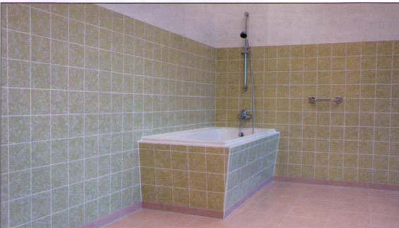
Aus alt ...